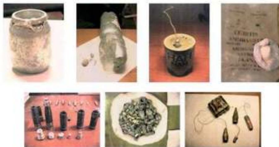
Фотографии взрывных устройств и их компонентов, изготовленных из штатных боеприпасов, аммиачной селитры и алюминиевой пудры, изъятых в процессе оперативно-розыскных мероприятий оперработниками ФСБ России

ПОМНИТЕ: внешний вид предмета может скрывать его настоящее назначение. В качестве камуфляжа для взрывных устройств используются обычные бытовые предметы: сумки, пакеты, свертки, коробки, игрушки и т.п.